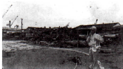
社の視察に仁井田に向かった。

●森林面積 84%を占める 本県の木材資 源を使ってバ イオマス発電 事業を行う、 土佐グリーン パワー株式会